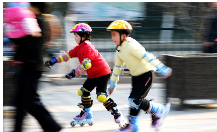
你追我赶