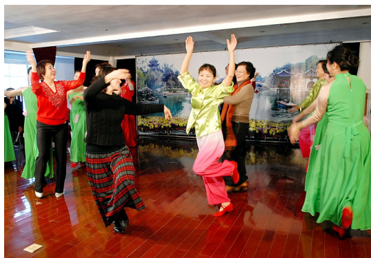
冬天里的一把火