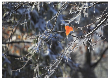
最后的坚持