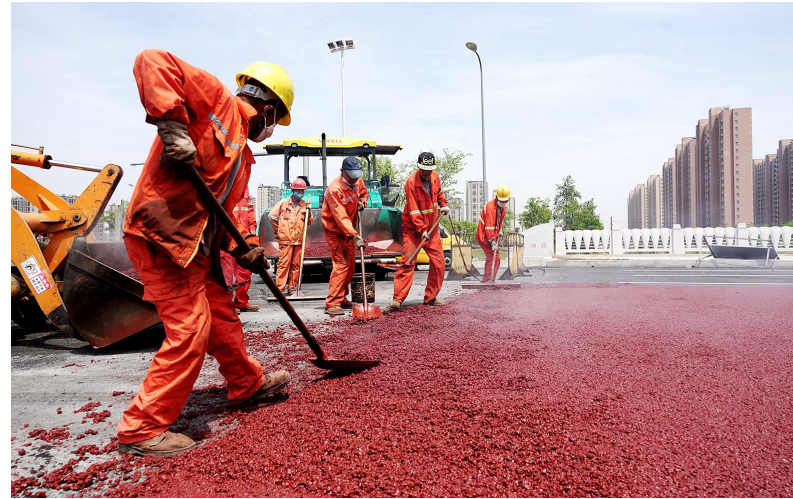
贤浦路BRT车道彩色沥青铺装现场