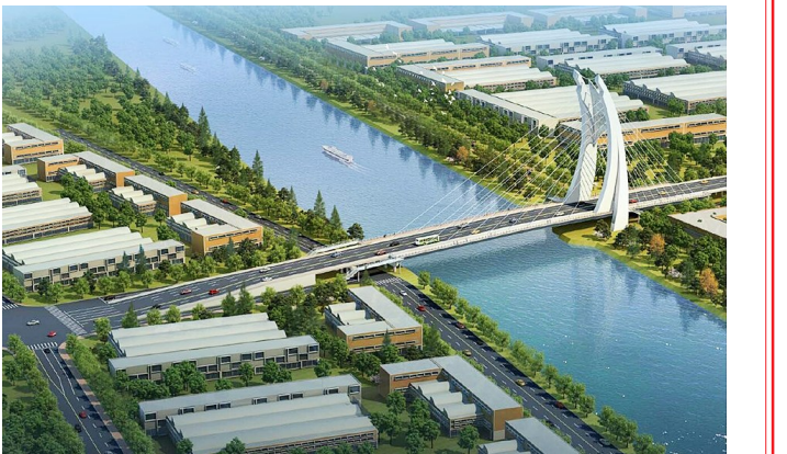
民乐路跨金汇港斜拉桥